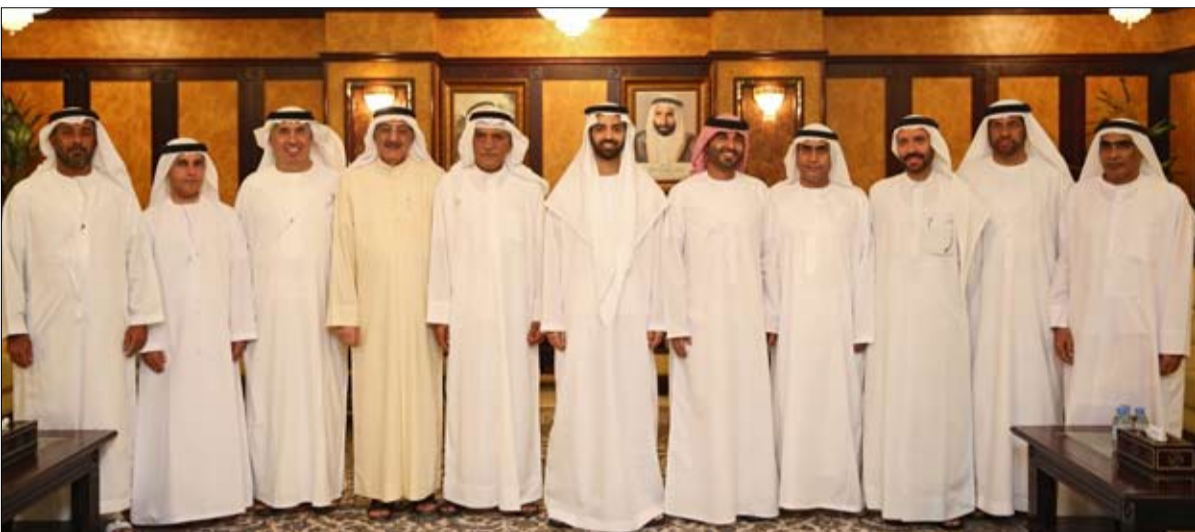
المرحلة المقبلة، وكان صاحب السمو الشيخ سعود 11 لعام 2013 خلال يونيو الماضي بإنشاء نادي رأس الخيمة الرياضي الثقافى انطلاقاً من حرص سموه على توسعة قاعدة قطاع الرياضة في الإمارة.